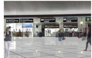
JR大阪駅おもてなしセンター 外観イメージ (2017年3月開設予定)

また、なんばCITYとなんばパークスの両施設では、中国人旅行者向けに、中国で人気のSNS「微博(ウェイボー)」「微信(ウィーチャット)」による情報発信を8月1日から開始したほか、9月下旬から「Osaka Free Wi-Fi」のスポットを増設する。